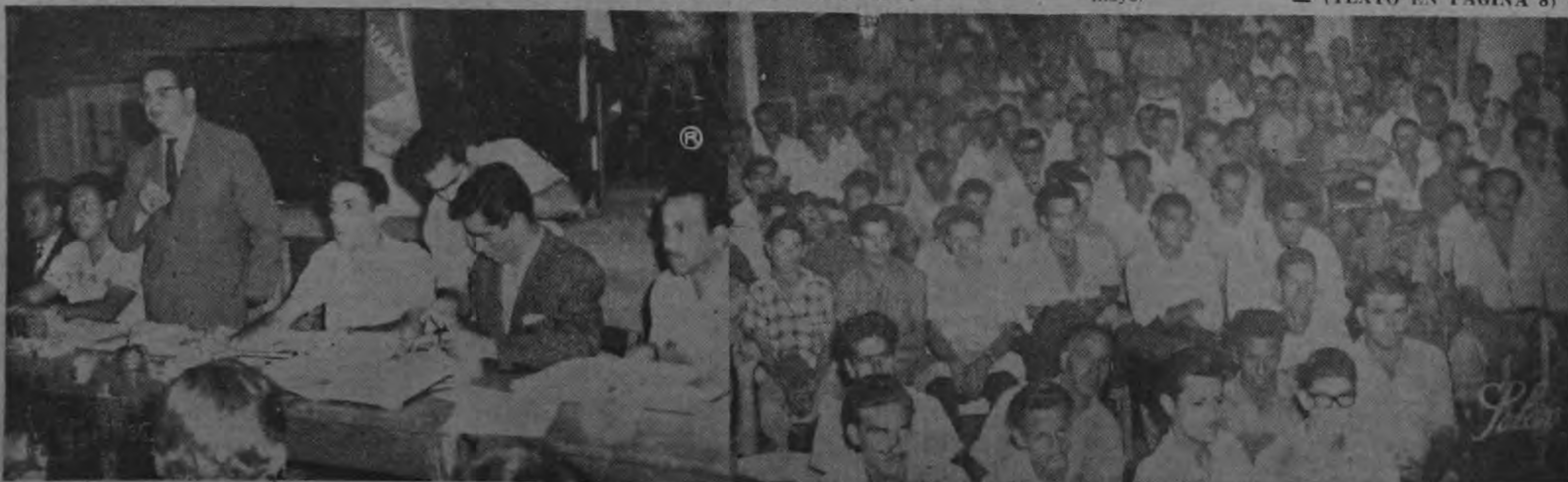
Vista parcial de la asamblea plenaria anual del poderoso sindicato UNEMOP. Casi mil sindicalistas asistieron a la asamblea que se efectuó en los propios talleres