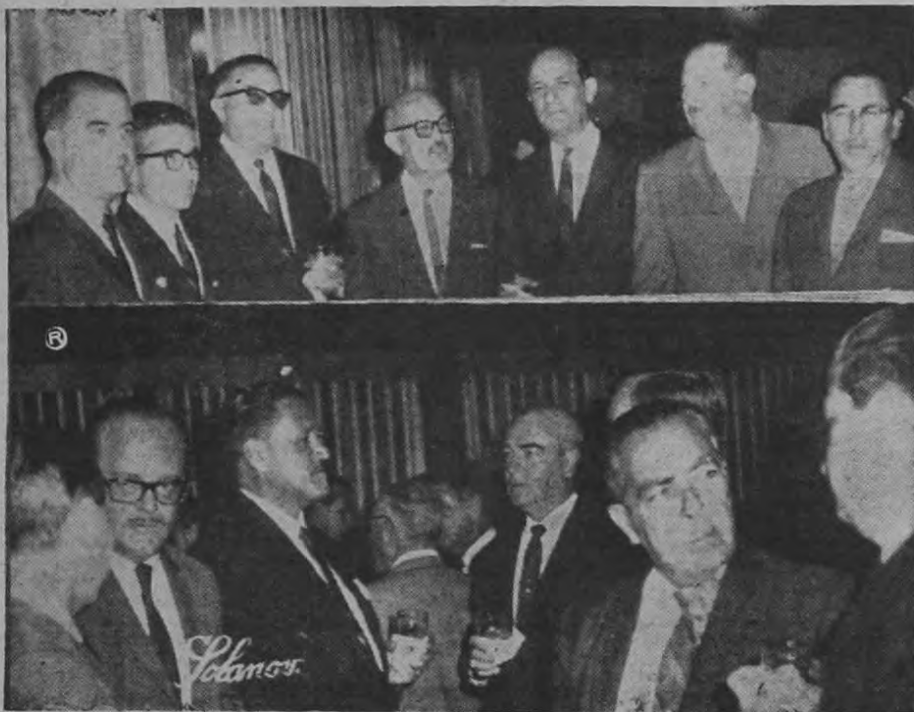
En una elegante recepción se celebró en los amplios salones del Costa Rica Country Club, el octavo aniversario de FINSA.