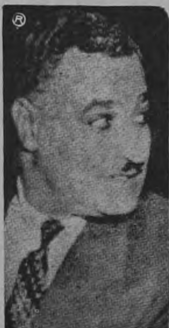
NASSER ...ordenó a sus soldados salir del Yemen...

NACIONES UNIDAS, 30 — (AP) — La República Árabe Unida (RAU) y Arabia Saudita, según se informó hoy, hay firmado un acuerdo para poner