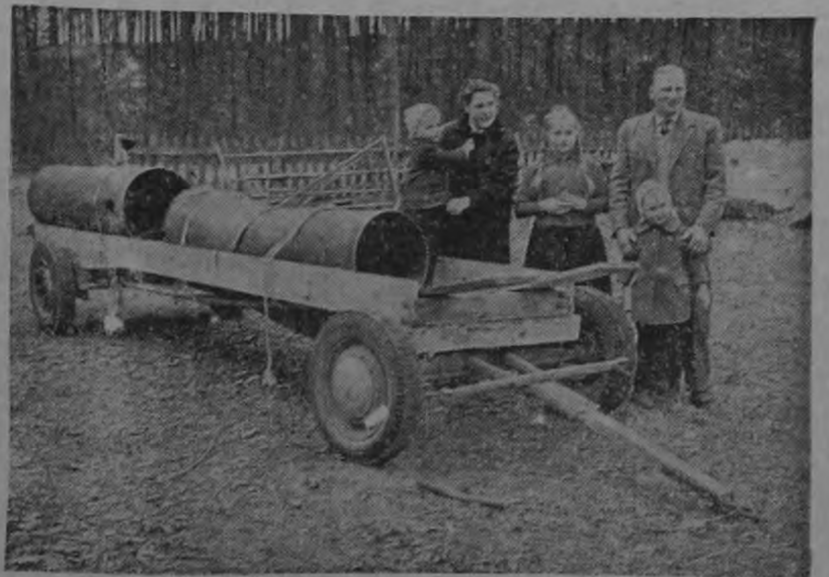
CON LA TAPA DE UN BAUL TIMONEARON dos familias de la zona soviética una primitiva almadía por el Elba, buscando la libertad. Diez personas, entre ellas cuatro niños se metieron con 30 bultos de equipaje en un viejo carro de labranza provisto de ruedas de goma y tubos herméticamente cerrados como flotadores. Como el motor precariamente colocado a bordo no arrancaba, el "carro flotante" fue a la deriva y puso a los fugitivos en peligro de muerte. Un